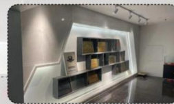
问题 4 Question four