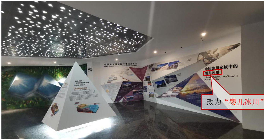
照片 1 达古冰川厅