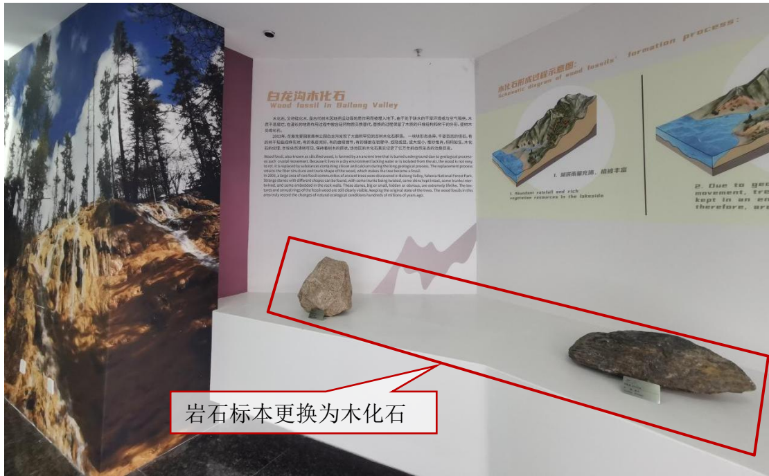
照片 2 白龙沟木化石展区

3. 将植物展区的岩石标本移到自然课堂厅，并购买或制作植物标本，设计制作相应的标本铭牌。