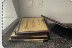
问题 1 Question one

建议增强整体空间的氛围烘托和打造，以整体空间及视觉氛围去提升，避免仅仅停留在背景墙一点上面，借助周边小范围空间及环境的共同营造来提升荣誉墙的现状问题。