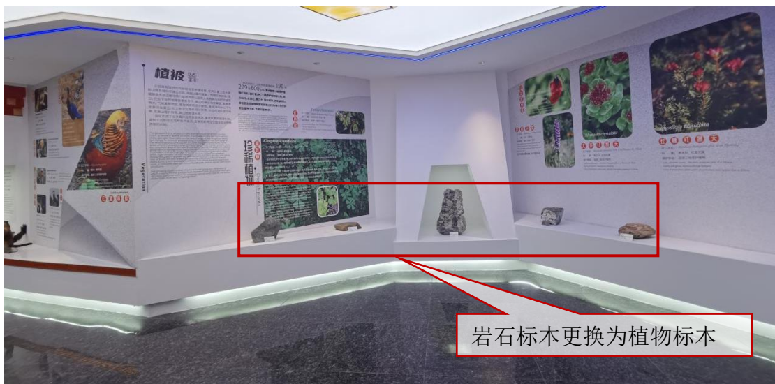
照片 3 动态家园厅植物部分展区