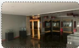
问题 2 Question two