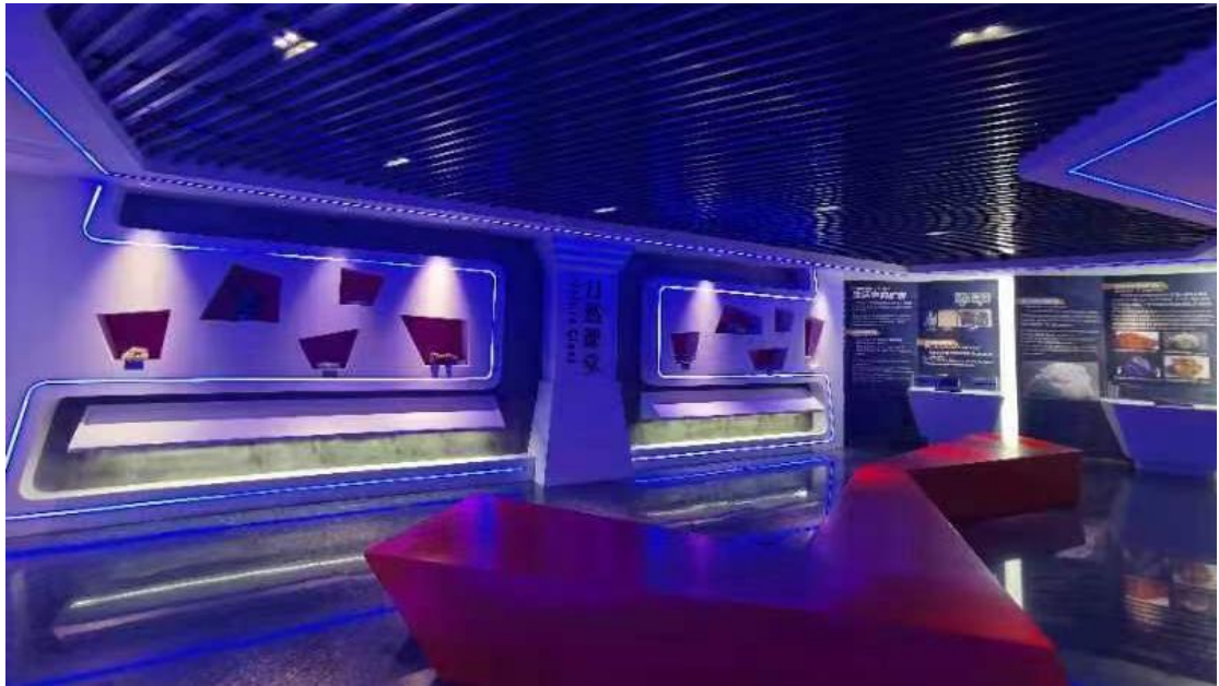
照片 4 自然课堂厅