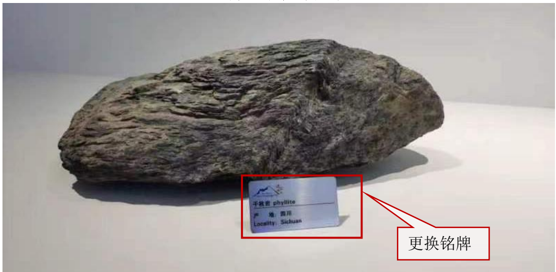
照片 5 岩石标本